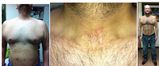
Fig. 3. Pre and pos. Cuerpo y zona de traqueotomía

Caso 3. #1458. Paciente varón 37 de años de edad, IMC-43. Tiroidectomía total previa – hipotiroideo. Diabetes en TM con Metformina e insulina. Hipertenso. SAOS con CPAP. Intentos repetidos de intubación. Traqueotomía más alta que la tiroidectomía. Se había planificado: GVL + derivación duodenal. Se hace sólo GVL. Estancia en UCI 2 días con enfisema subcutáneo en facies y cuello. Alta a los 11 DPO. A los 3 meses, IMC-31 y está asintomático y sin insulina.